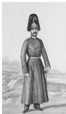
Обер-офицер Корпуса жандармов (1854–1855)