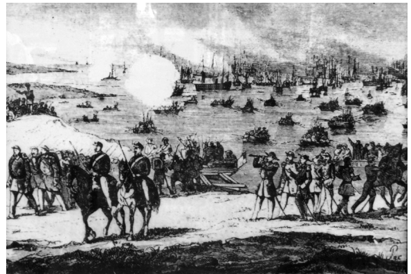
Высадка войск союзников в Крыму. Сентябрь 1854 г.