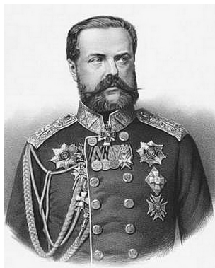
Граф Николай Владимирович Адлерберг (1819–1892), генерал-адъютант (1857), генерал от инфантерии (1870), губернатор Таврической губернии (1854–1856)

29 человек – без объяснения причин высылки) 1 .