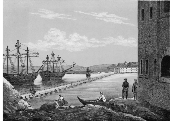
Мост с Южной стороны Севастополя на Северную. Из «Севастопольского альбома Н. Берга». 1858 г.

В опустевшем французском лагере, который перешел под управление жандармского полковника, осталось 152 семейства торговцев и разный люд – французы, греки, итальянцы, турки, персы и армяне, большая часть которых не имела паспортов, средств для жизни, «предавалась воровству, грабежу и убийствам». Для надзора за ними были установлены усиленные патрули 10 . 16 июля, после того как оставшееся после французов лагерное имущество было