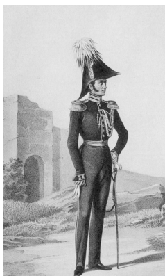
Генерал Корпуса жандармов (1827–1845)

В середине XIX в. структура политической полиции Таврической губернии, входившей в состав V жандармского округа, была представлена следующим образом. В Симферополе располагалось управление губернского штаб-офицера, в состав которого также входил обер-офицер, исполнявший обязанности адъютанта, и 4 нестроевых нижних чинов. Главной задачей данного управления был контроль над деятельностью трех жандармских команд: Симферопольской, Севастопольской и Керченской. Из первых двух каждая состояла из обер-офицера (начальника команды), 4 унтер-офицеров, 24 рядовых и 4 нестроевых чинов (писаря, коновала, кузнеца и денщика). Керченская портовая жандармская команда была наименьшей по численности и включала в себя обер-офицера, 2 унтер-офицеров, 12 рядовых и 4 нестроевых чинов. Общий штат Корпуса жандармов на территории Таврической губернии составлял 91 человек 1 .