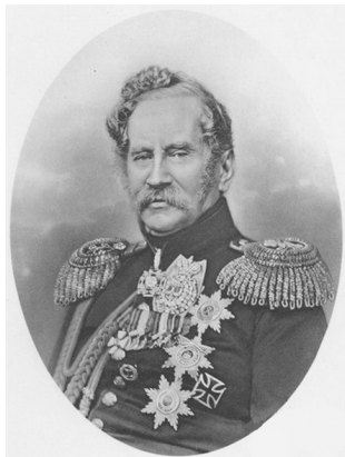
Князь Алексей Фёдорович Орлов (1787–1862), генерал от кавалерии, генерал-адъютант, главный начальник III Отделения Собственной Е. И. В. канцелярии и шеф жандармов (1844–1856)

Несмотря на то, что сфера компетенции политической полиции была практически безграничной, реальная деятельность её сотрудников в регионе на протяжении почти всей первой половины XIX в. в большинстве своём сводилась к «понууждению к исполнению законов и приговоров судов». Чины ее посылались на поимку беглых крестьян, задержание беспаспортных лиц, на преследование воров, контрабандистов, «запрещенных скопищ», препровождение важных преступников и арестантов, участие в рекрутских наборах 2 , расследование крупных пожаров и преступлений 3 . Жандармы присутствовали в качестве временных комендантов на ярмарках (на Никольской в Каховке и Покровской в Симферополе), торжищах, церковных и народных празднествах, гуляньях 4 . Штаб-офицеры обязаны были также осуществлять надзор за местным госаппаратом, докладывать в III Отделение о настроениях в местном обществе 5 .